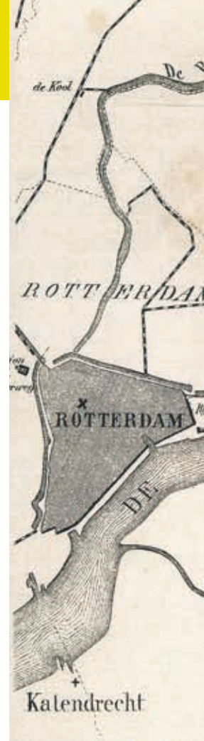
▲ Plattegrond van het dorp Kralingen.

De vervening had grote gevolgen voor Kralingen die in de eerste helft van de negentiende eeuw zichtbaar werden. 2 Het oude dorp, met de hervormde kerk en een kleinere katholieke kerk, het ambachts- of rechthuis, het armhuis en de school, lag waarschijnlijk sedert het begin van de zestiende eeuw aan de smalle Veenweg die in de loop der tijd door veenplassen omgeven raakte. Door toenemende vernatting en afnemende bestaansmogelijkheden trokken dorpingen al vanaf het begin van de achttiende eeuw weg naar het droge, zuidelijke deel van Kralingen. Een populaire nieuwe vestigingsplaats aldaar was het gebied rond de zogenaamde