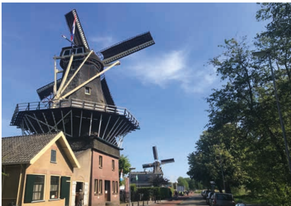
◀ Molen De Ster aan de Kralingse Plas anno 2019.