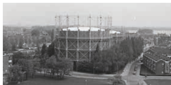
^ Eerste fase van de Gasfabriek Oostzeedijk.